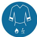
Antistatische en vlamvertragende werkkleding