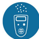
Gassignaleringsapparatuur met akoestisch en optisch signaal