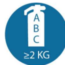
Brandblusser (klasse A/B/C) van minimaal 2 kg